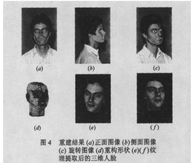
图4 重建结果 (a)正面图像 (b)侧面图像 (c)旋转图像 (d)重构形状 (e)(f)纹理提取后的三维人脸

m^ " a " a " ¥ " ½ G Q É, M™ Ä ¥ " ó ß } : Qª ¥² T V i V [ A X Ü V [ r ž z ¥ x y r T " " ó N $ ¥ Ö Ø x y² T #